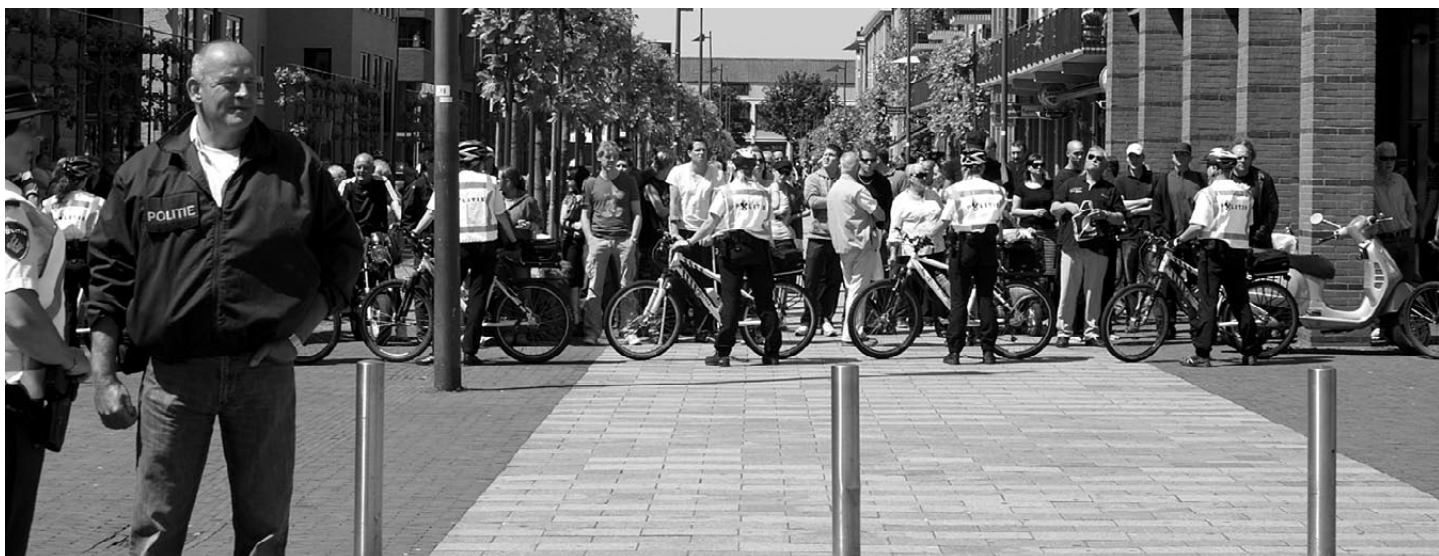
Politie-afzettingen rond het Leonardo da Vinci-plein bij het voorverzamen van de NVU-demonstranten. De nazi-mars is nog niet onderweg of de eerste arrestaties onder omstanders vallen, Den Bosch, 23 mei 2009

De politie concludeerde het al eerder, en sinds Den Bosch staat het vast, zoals u in het hoofdstuk 'Op de gemeentelijke burelen' heeft kunnen lezen, in een gerechtelijke uitspraak; demonstraties van de NVU brengen altijd tegenstanders op de been. Er wordt door de politie veel aandacht besteedt aan het afgrazen van websites waar oproepen staan en die signalen worden dan gebruikt om de noodverordening en de enorme politie-inzet te rechtvaardigen. Er klopt echter iets niet. De telkens door de politie in de draaiboeken (zo vroeg de politie Brabant-Noord