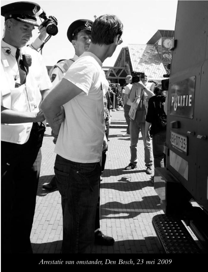
Arrestatie van omstander, Den Bosch, 23 mei 2009

komen, bleken onzin. Het zette desalniettemin de toon voor de dag.