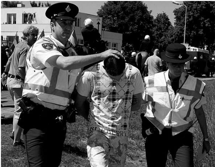
Arrestatie van omstander, Den Bosch, 23 mei 2009

Onbekend (1992): “Vraag: Heb je geluisterd naar de aanwijzingen van de politie? Antwoord: Ja, maar ik kan niet tussen de ME doorspringen. Dan is het ook niet goed. Wat die agent zei kon ik niet doen. Vraag: Waarom heb je geen legitimatie bij je? Antwoord: Die ben ik vergeten. Ik heb mijn legitimatie normaal gesproken in mijn portemonnaie. Ik heb nu een korte broek aan en heb geen portemonnaie meegenomen. Ik denk dat als ik mijn legitimatie bij me had gehad ik niet was aangehouden. Dus eigenlijk vind ik het nergens op slaan dat ik daarvoor zolang hier moest zitten.” Verdachte werd samen met vriend (1992) aangehouden. Deze had ook geen legitimatie bij zich.