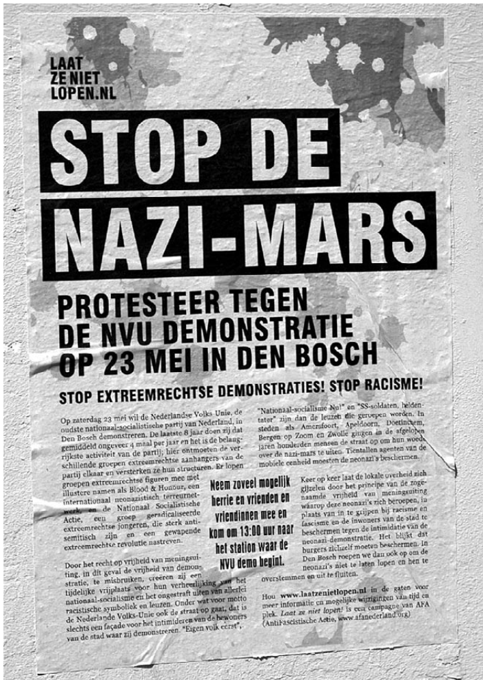
Eén van de posters van LaatZeNietLopen met de oproep voor een tegengeluid in Den Bosch op 23 mei 2009