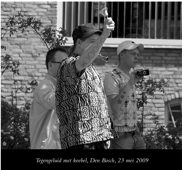
Tegengeluid met koeibel, Den Bosch, 23 mei 2009

Ik ben daarna over straat gesleurd, wat bepaald geen pretje was; dit ging