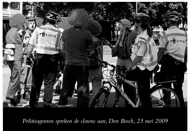
Politieagenten spreken de clowns aan, Den Bosch, 23 mei 2009