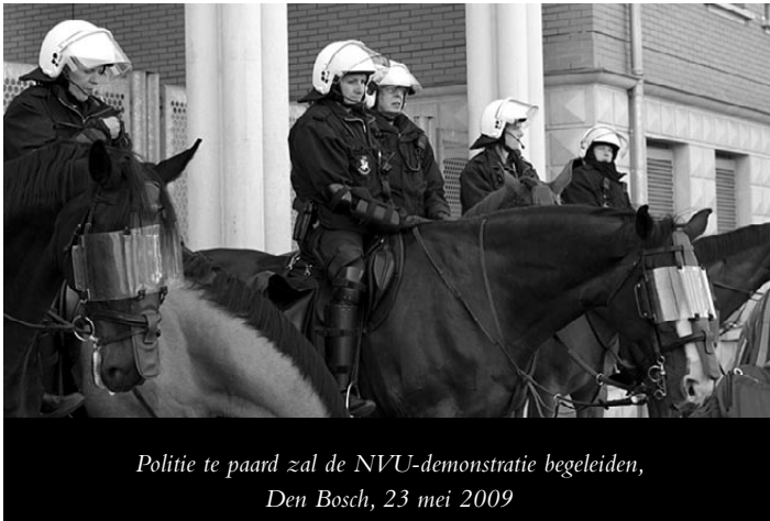
Politie te paard zal de NVU-demonstratie begeleiden, Den Bosch, 23 mei 2009

Met dit zwartboek willen wij aantonen dat een dag zoals in Den Bosch op 23 mei 2009 niet zomaar vergeten kan worden. Daarvoor is de willekeur en het onrecht te groot geweest. En zulke dagen vinden meerdere malen per jaar plaats in Nederland.