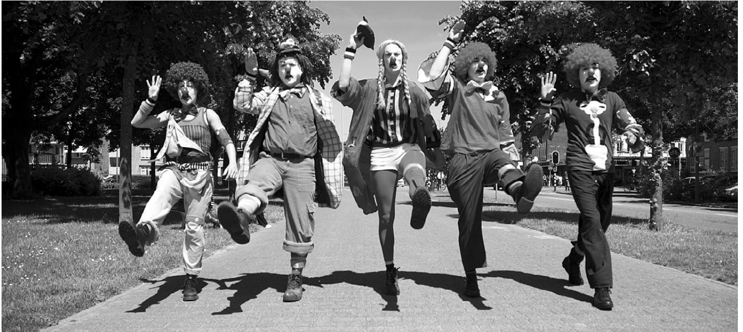
Het Nationaal Eendjes Front marcheert tegen 'vreemde vogels', Den Bosch, 23 mei 2009

succesvol beoefend. In reactie op de NVU-oproep tegen het casinokapitalisme en de plutocratie maakten de clowns statements omtrent het veel grotere gevaar van het 'Flamingokapitalisme' en de 'Pinocratie': in de afgelopen jaren zijn er steeds meer flamingo's de Nederlandse dierentuinen binnen gedrongen. Deze lelijke, roze vogels van over de grens zijn de ware bedreiging! Vooral voor de Nederlandse eendjes! Ook Pino (stomme vogel uit Sesamstraat) moet worden gedeporteerd! Daarom zeggen wij: Stop de 'Pinocratie'! Onmiddellijk!"