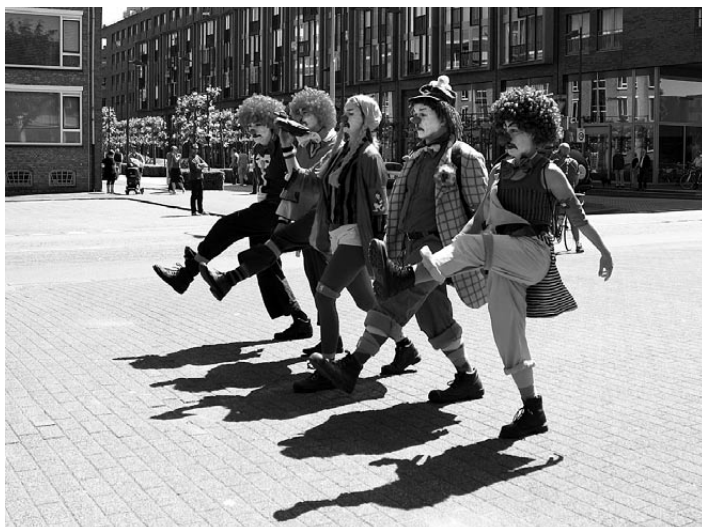
Het Nationaal Eendjes Front loopt alvast warm in afwachting van publiek, Den Bosch, 23 mei 2009

succesvol beoefend. In reactie op de NVU-oproep tegen het casinokapitalisme en de plutocratie maakten de clowns statements omtrent het veel grotere gevaar van het 'Flamingokapitalisme' en de 'Pinocratie': in de afgelopen jaren zijn er steeds meer flamingo's de Nederlandse dierentuinen binnen gedrongen. Deze lelijke, roze vogels van over de grens zijn de ware bedreiging! Vooral voor de Nederlandse eendjes! Ook Pino (stomme vogel uit Sesamstraat) moet worden gedeporteerd! Daarom zeggen wij: Stop de 'Pinocratie'! Onmiddellijk!"