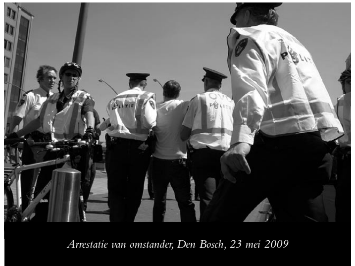
Arrestatie van omstander, Den Bosch, 23 mei 2009

Op 14 januari 2010 stond een verdachte wegens verbale bedreiging met misdrijf en opruiing voor de politierechter. Voor opruiing werd hij vrijgesproken, en voor de overige feiten werd hij tot drie dagen gevangenisstraf veroordeeld. Die drie dagen stonden gelijk aan zijn voorarrest. Op dit moment ontbreken bij ons verdere gegevens over deze zaak.