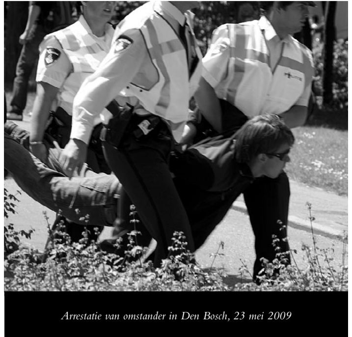
Arrestatie van omstander in Den Bosch, 23 mei 2009

De verhoorder begon steeds meer geprikkeld te worden en de sfeer werd wat gespannen. Toen heb ik gevraagd of ze de reden van mijn aanhouding niet op een formulier zou moeten kunnen vinden. Nadat we de formulieren hadden nagekeken bleek de reden van mijn aanhouding nergens te vinden te zijn. Hierop heb ik de rechercheur uitgelegd dat het niet de taak van de arrestant is de reden voor zijn arrestatie op te geven en dat het de taak van de politie is de arrestant bij de voorgeleiding te vertellen waarom deze is aangehouden. Weer heb ik gemeld dat, omdat ik én de politie niet op de hoogte waren van de reden van mijn aanhouding, ik onmiddellijk in vrijheid gesteld moest worden. Hierop werd de sfeer wat meer ontspannen en werd mijn verklaring uitgetypt, ik heb een kruisje gezet en werd weer naar mijn cel begeleid. Pas anderhalf uur na mijn verhoor ben ik vrij gelaten!"